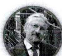
MASSIMO TAVOLA SECONDARIA DI PRIMO GRADO